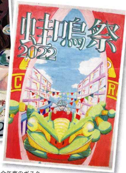
今年度のポスター