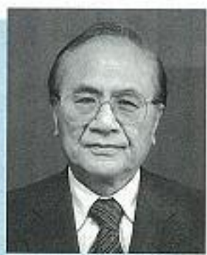
獨協埼玉高校学校長