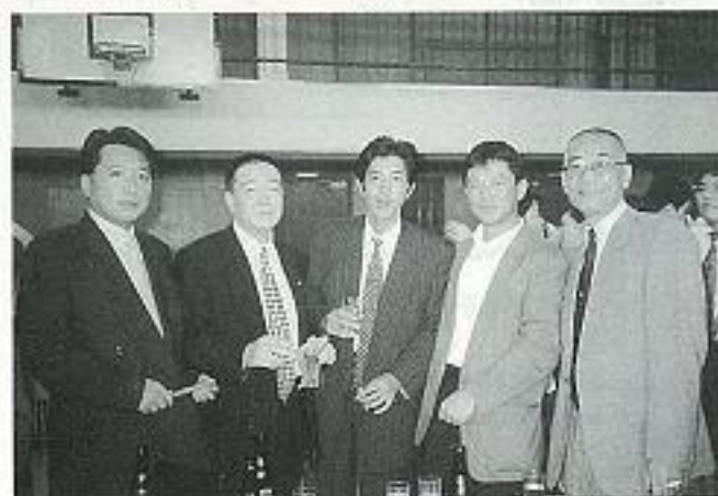
第1回同窓会総会・先生との懇親